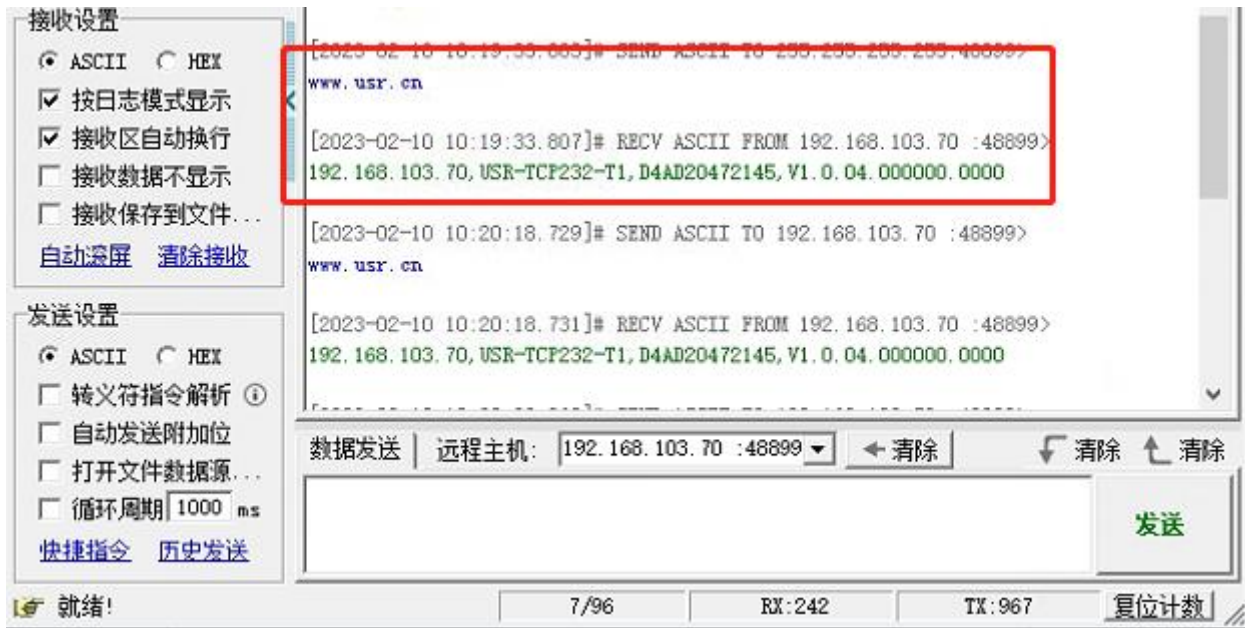
图 1 准备进入网络 AT 模式

通过网口 UDP 广播发送向端口 48899(远程主机设置为 255.255.255.255:48899)发送 www.usr.cn，如果模块和电脑在同一网段内，则会收到模块回复的信息。