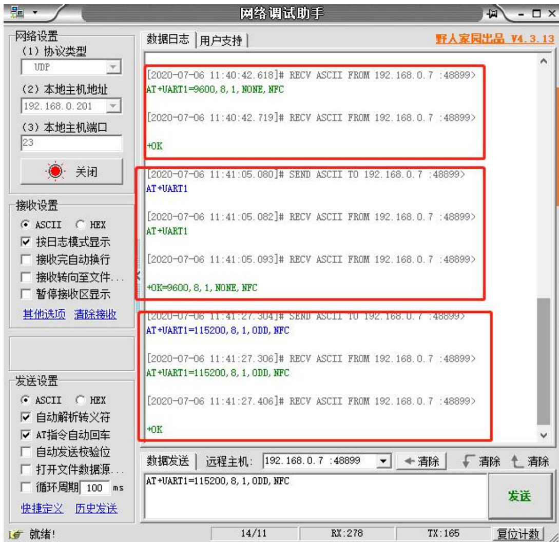
图 3 网络 AT 指令设置和查询